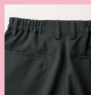
後ろ脇ゴム・ 後ろ2つポケット