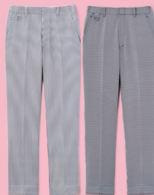
02. SPAU-1920-K6 (ストライプ)