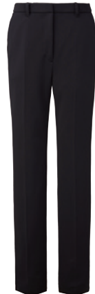
ストレートパンツ