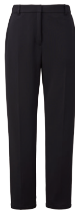
テーパードパンツ