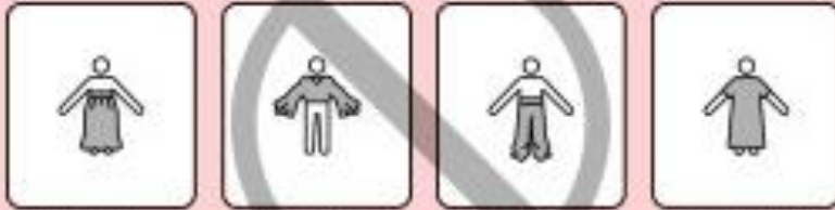
ロングスカート ルーズシャツ ルーズパンツ ビッグサイズ

全体に柄がついた服、体のラインが見えにくいものや、 主要なパーツが隠れるロングスカート、ルーズシャツ、ルーズ パンツ、ビッグサイズの服などは避けるようにしてください